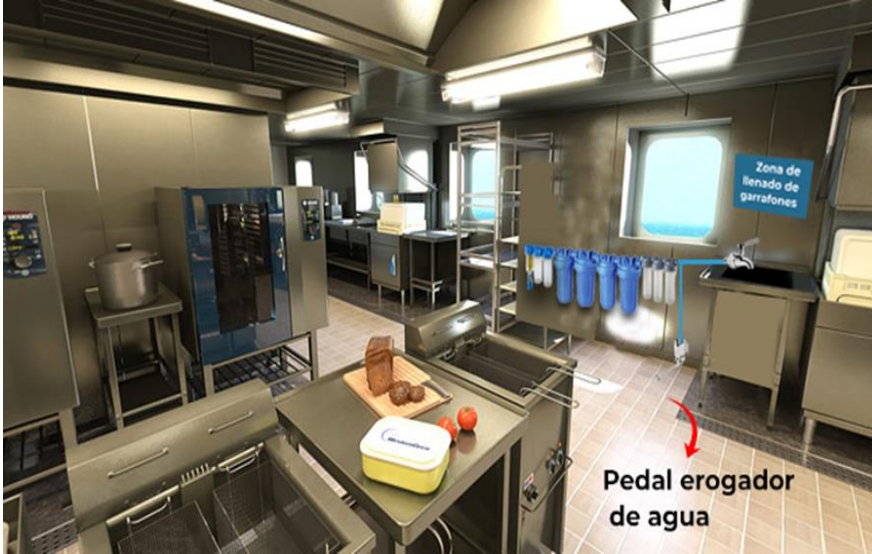
ESTACION DE ULTRA PURIFICACIÓN DE AGUA PARA INGESTA HUMANA COCINAS BUQUES CARGO.

De esta forma estamos generando beneficios en materia económica importantes tanto a las líneas navieras como a la tripulación.